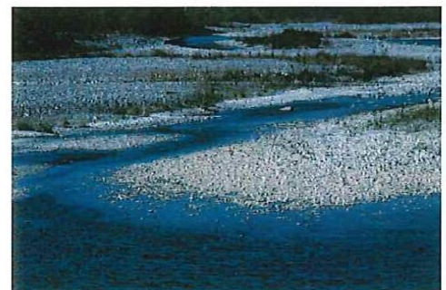
万葉集東歌紀行 岸哲男 三彩社