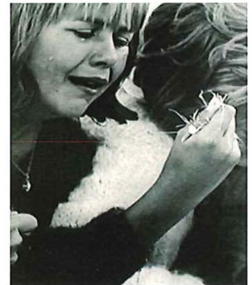
The Best of LIFE タイムライフブックス