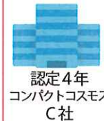
認定4年 コンパクトコスモス C社

人事異動等でシステム最高責任者やシステム管理者が交代したとしても、システムマニュアルに沿った安全衛生管理が維持・展開できます。