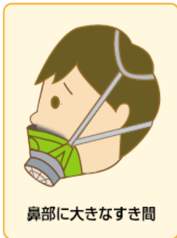
鼻部に大きなすき間