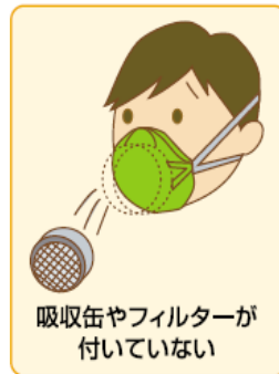
吸収缶やフィルターが 付いていない