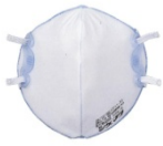
使い捨て式防じんマスク

がれきの粉じんには石綿が含まれているおそれがあります。事業者の指示に従い、適切なマスクの着用をお願いいたします。