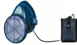
電動ファン付き呼吸用保護具