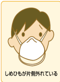
しめひもが片側外れている