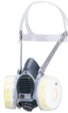
取替え式防じんマスク